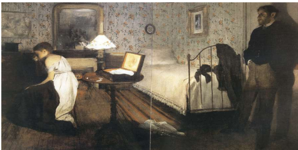
Intérieur, dit Le viol - Edgar Degas

OCTAVE - Ne vous inquiétez pas. J'inventerai une histoire. Campardon ne nous mangera pas !