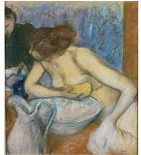
La Toilette - Edgar Degas