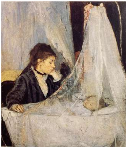
Le berceau - Berthe Morisot