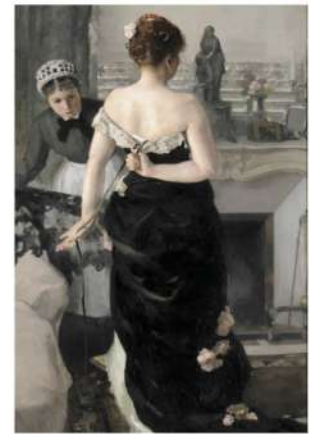
Après le bal - Alfred Roll