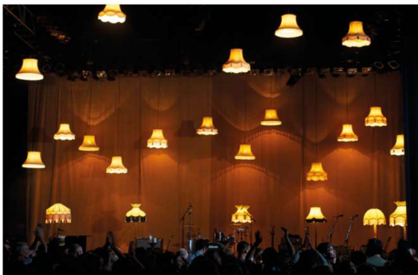
Concert Adèle - Rob Sinclair - London festival 2011