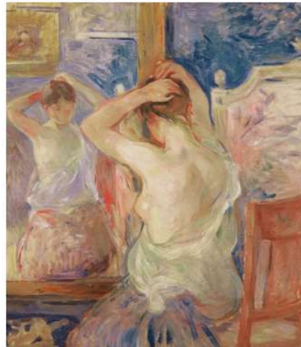
Devant le miroir - Berthe Morisot