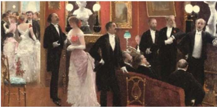
Bal - Jean Béraud