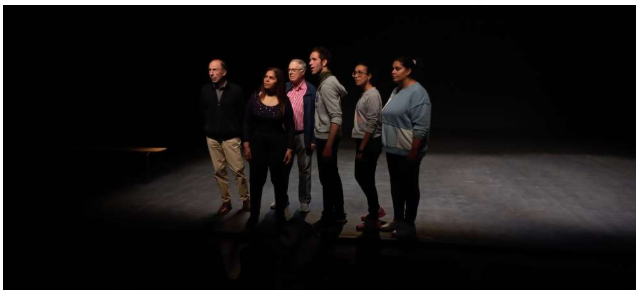
Amateurs de l'Atelier Génération(s) - Maison du Théâtre et de la Danse . Épinay-sur-Seine

Le cœur de ce volet supplémentaire est de réunir les comédiens créateurs des solos et de les mêler sur scène à une bande d'amateurs de tous style et tous âges , habitants dans la ville qui nous accueille. Le texte du spectacle est fixe, mais les passages interprétés par les amateurs pourront être en partie réécrits par eux lors d'ateliers d'écriture en amont des répétitions dans chaque ville.