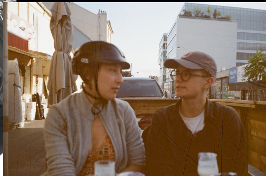
2023 (à côté du Sample)